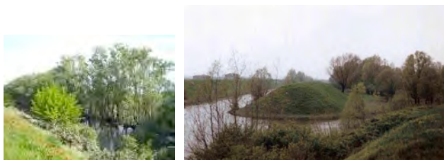
Fig. 2 Bosco del Lavacci