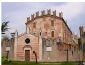
Fig. 5 Villa Miari de' Cumani