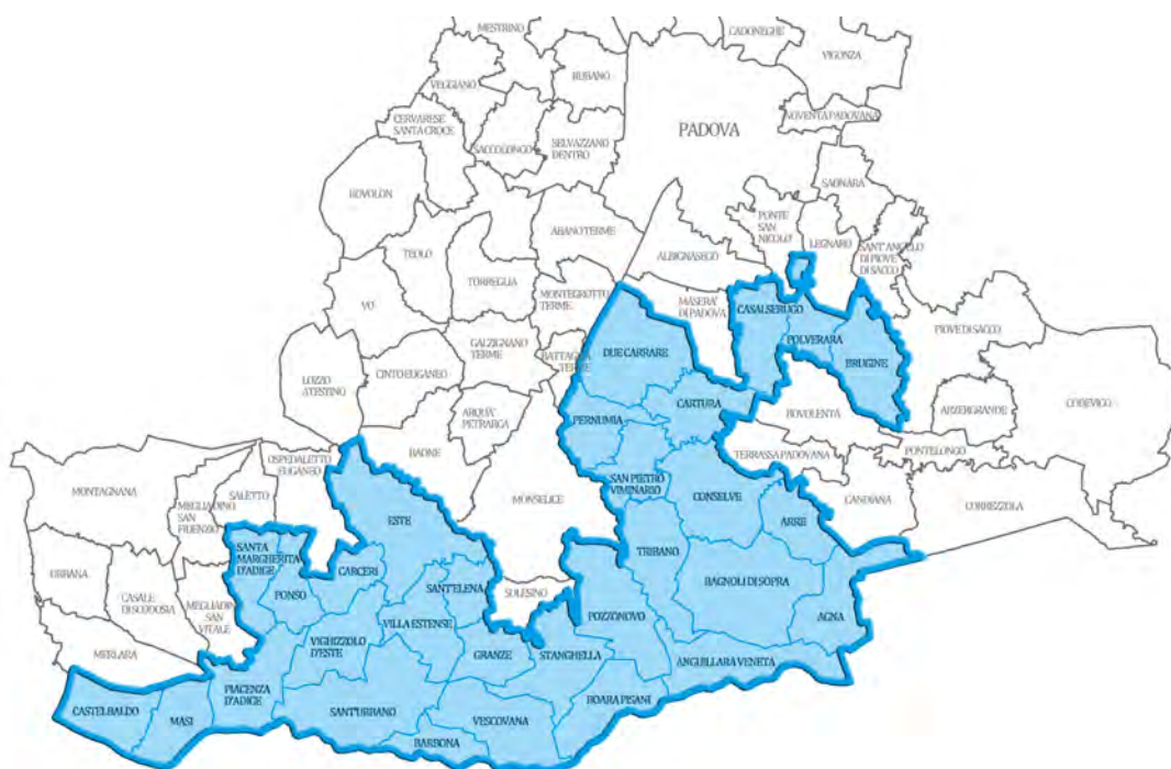
Fig. 1: L'area in blu esemplifica la Bassa Padovana

In più, la zona della Bassa Padovana si presenta con caratteristiche morfologiche e ambientali in sintonia con le prerogative del turismo rurale: pertanto, essa si rivela un territorio adatto ad essere meta di questa tipologia di turismo.