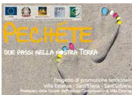
Fig. 7: Logo del progetto Pechéte

Durante l’anno scolastico 2013/2014 gli studenti delle classi 1° e 2° delle Scuole di Villa Estense e Sant’Urbano e 3° della Scuola secondaria di Sant’Elena hanno realizzato una mappa per ripercorrere e raccontare questi luoghi, nonché realizzando essi stessi delle visite guidate presso Palazzo San Bonifacio Ardit a Villa Estense, la Barchessa comunale e Villa Miari De’ Cumani a Sant’Elena e Villa Nani Loredan a Sant’Urbano.