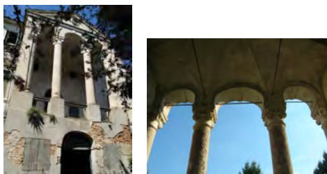
Fig. 3 Villa Grompo-Pigafetta

I piccoli centri che si adagiano sulla pianura della Bassa Padovana sono ricchi di storia, le cui tracce evidenti rimangono oggi in numerose ville di famiglie nobiliari che risiedevano vicino alle loro campagne, come Villa Miari de' Cumani a Sant'Elena (fig.5) e Villa San Bonifacio Ardit a Villa Estense (fig.6), solo per citarne alcune. Anche le chiese e i capitelli sparsi nei borghi rurali costituiscono patrimonio storico e artistico per la zona; inoltre, numerosi reperti paleoveneti arricchiscono le strutture museali di cui sono dotati alcuni comuni tra cui Stanghella e Villa Estense.